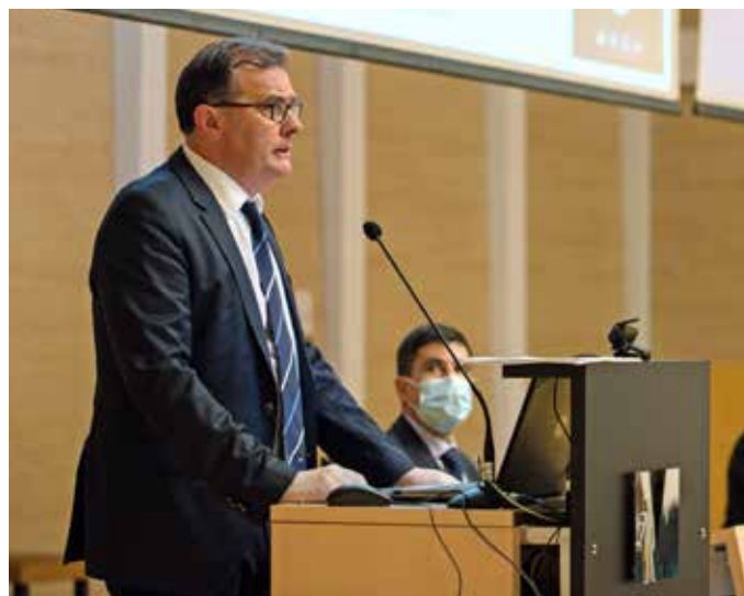
» Prof. dr. sc. Ante Tonkić; autor fotografije: Dalibor Gabela.

Dobitnik je dvije rektorove plakete za stručni, znanstveni i nastavni rad (Sveučilište u Splitu 2020. i Sveučilište u Mostaru 2019. godine). Od samog početka Domovinskog rata časnik je saniteta ZNG-a te 114. br. HV-a Split. Odlikovan je Spomenicom Domovinskog rata 1990./1992. i Medaljom Oluja.