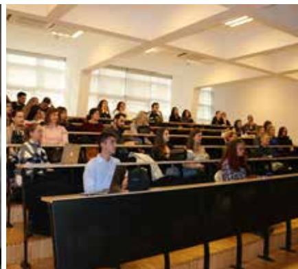
» Slika s prvog održavanja Journal Club - a

studenta Dentalne medicine DentiST . Ostvarili smo i suradnju s udrugom koja se bavi promocijom zdrave prehrane i fizičke aktivnosti, Zdravi dan.