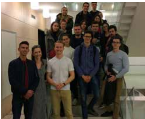
» Slika sa zajedničkog gledanja filma „Forks over knives“