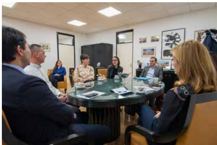
» Meeting and handover