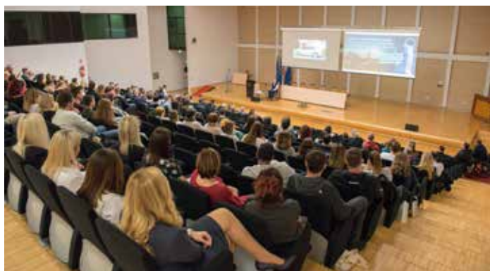
» Prepuni amfiteatar Medicinskog fakulteta svjedočio je o dobro odabranim temama Tečaja.