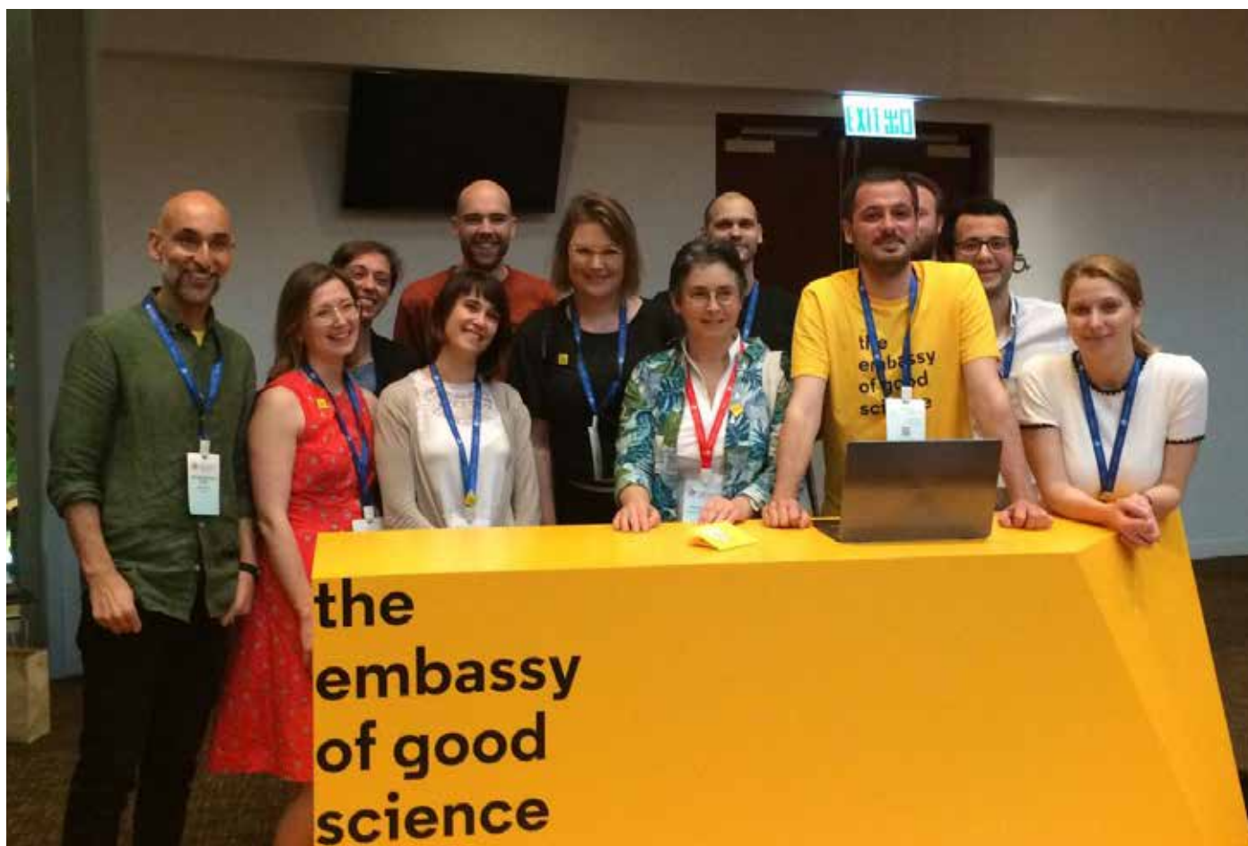
» Veleposlanici u Hong Kongu

Medicinski fakultet u Splitu. Osim našeg fakulteta, u projekt i u Embassy uključena su i sveučilišta iz cijele Europe, kao što su sveučilišta u Amsterdamu, Leuvenu, Oslu, Ankari, Ateni, Europska mreža etičkih povjerenstava te Austrijska agencija za istraživačku čestitost. Embassy je doživio svjetsku premijeru na skupu World Conference in Research Integrity u Hong Kongu 2019. godine, ali stranica se stalno mijenja i dopunjuje te će uskoro dobiti nove mogućnosti koje će olakšati suradnju korisnika, kao i lakšu izmjenu sadržaja na stranici.