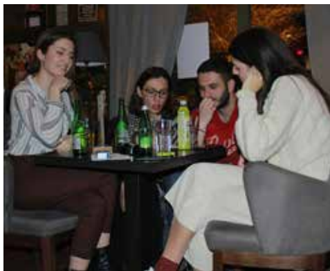
» Slika s Pub Quiza u caffe baru Exhibeo